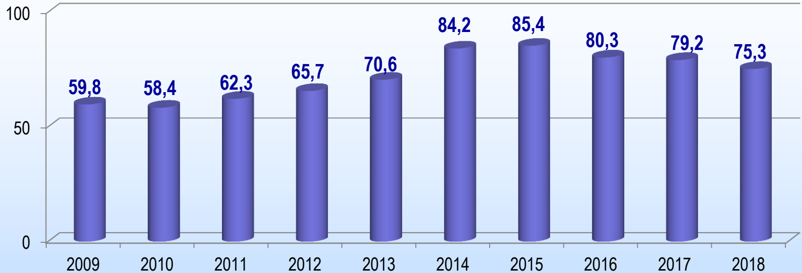
Количество выданных ипотечных кредитов, тыс. шт.