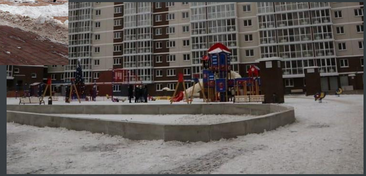
дом №9 в мкр. «Европейский»