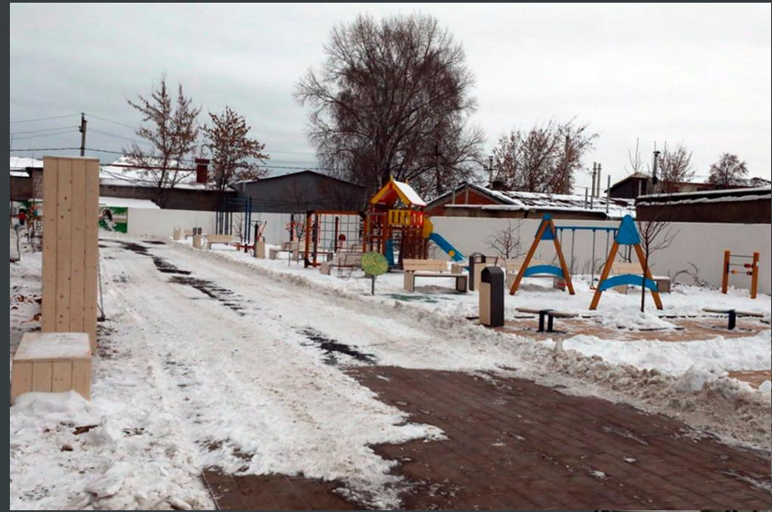
дом №24 по ул. Ударников

Пример реализованной инициативы: дом по ул. Ударников (СЗ «Строймастер»), дом №9 в мкр. «Европейский» (СЗ «ОДСК-Л2»)