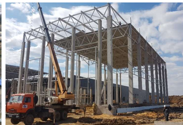
Строительство завода резидента ОЭЗ «Липецк» ООО «Лэм Уэстон Белая Дача»