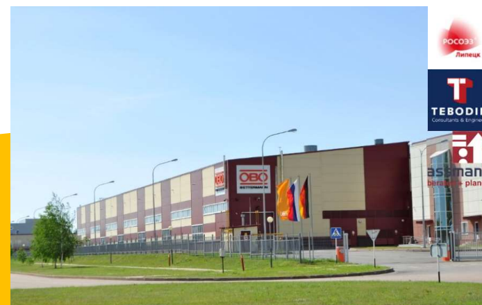
ОБО Беттерманн Производство