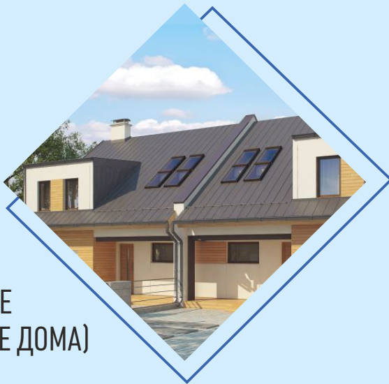
БЛОЧНАЯ (БЛОКИРОВАННЫЕ ДВУХКВАРТИРНЫЕ ДОМА)