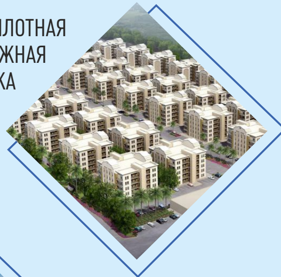
ВЫСОКОПЛОТНАЯ МАЛОЭТАЖНАЯ ЗАСТРОЙКА